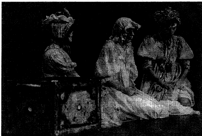
Macunaíma (Brasil). Nova velha estoria de Antunes Filho.