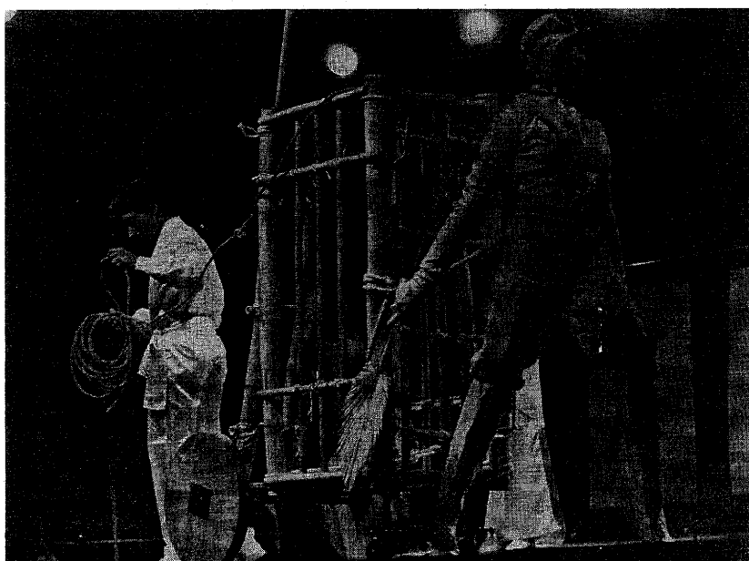
Teatro de Tegucigalpa (Honduras). Morazán de la celda al paredón .