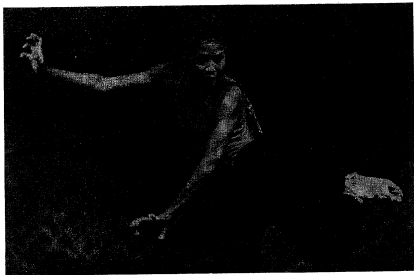
Grupo Oveja Negra (Panamá). Los silencios del jaguar.