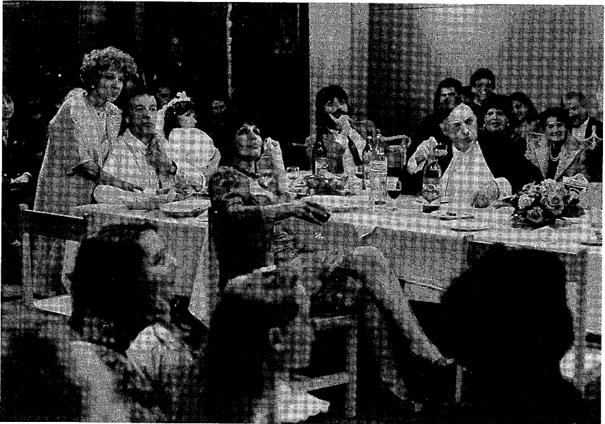
La boda de Bertolt Brecht.