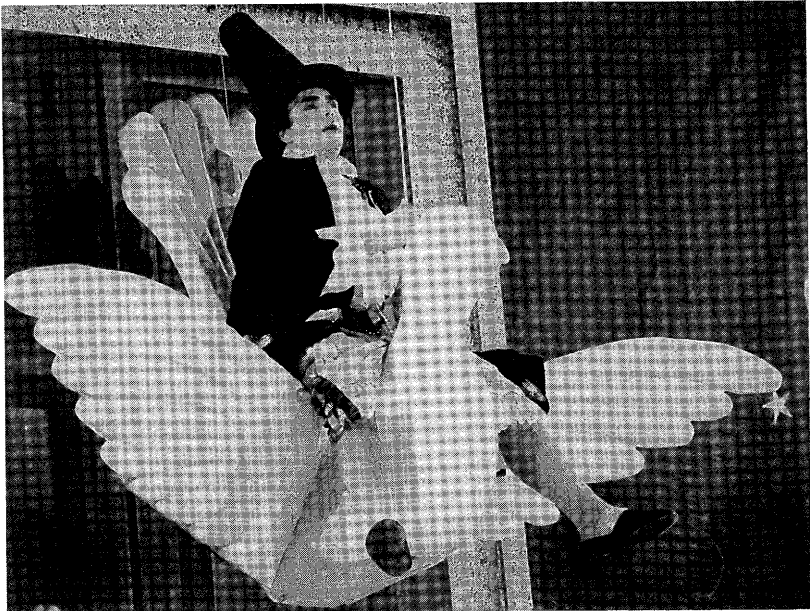
El enfermo imaginario de Molière.