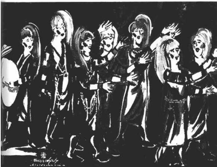
A las kanteras

B. N.: Hombre, se puede saber más o menos, el libro de clausura (1) es quizás el que recoja mas obras, pero luego hay muchas otras que no ha salido en ese libro, de coleccionistas privados,