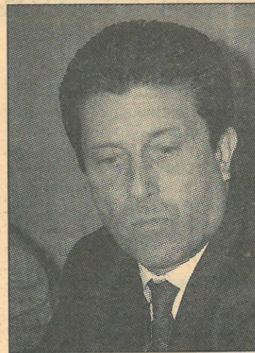
Federico Mayor Zaragoza